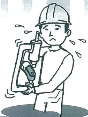
ハンドドレッサー / ヤスリ